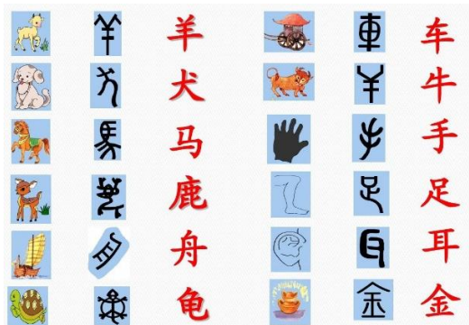
图2. 主要象形字示例