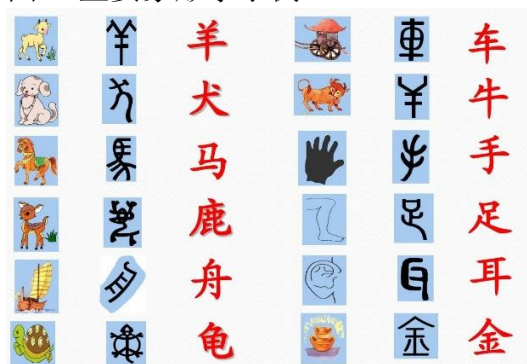
图2. 主要象形字示例